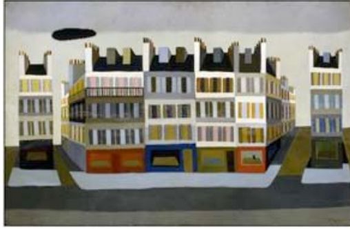
V. PAGAVA. 1953 Rue de Rivoli 65x100cm